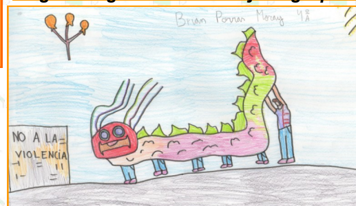
El dragón chino, según Brian Porras, 4º