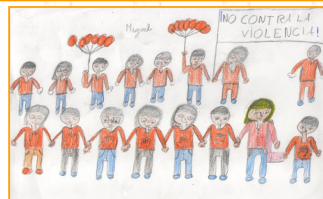
Miguel Ángel de 4º A reflejó al grupo