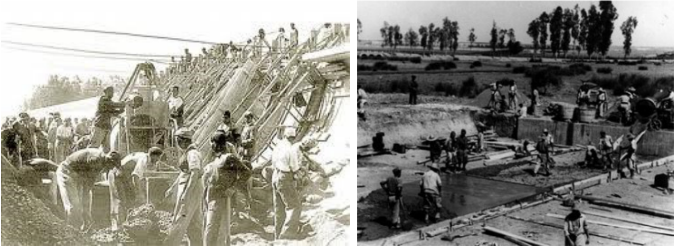
Canal del Bajo Guadalquivir en construcción

Esta no fue la única obra que se realizó por presos políticos en Andalucía, pero sí la más significativa.