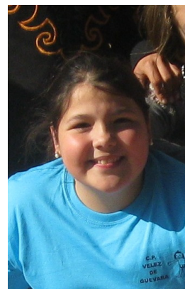
AUTORA : PAULA COPADO