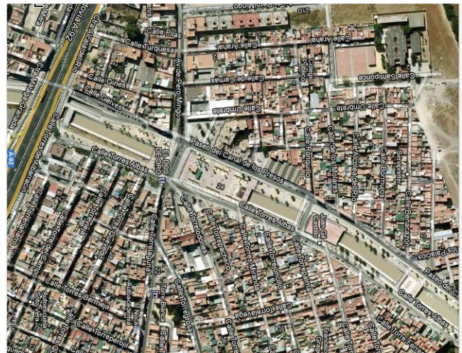
Vista aérea del estado actual del canal con la canalización cubierta y convertida en un bulvar.

En el boletín de marzo, tendréis la quinta entrega de mi barrio Torreblanca: “HISTORIA DE LA HERMANDAD DE LOS DOLORES”.