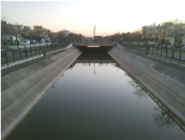
El Canal a su paso por Torreblanca antes de ser tapado y convertido en un bulvar.

La barriada de Torreblanca no se entiende sin la actividad directa generada por las obras del canal y las transformaciones hidráulicas del Bajo Guadalquivir y, también, por las derivadas de una población reclusa que vivió en los campos de concentración al servicio de estas obras, y en cuyos aledaños se asentaron sus familiares en condiciones penosas de supervivencia y drama humano.