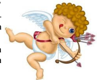
Cupido, Dios romano del amor

Si queréis ampliar esta información podéis leer en la biblioteca el boletín de febrero de 2011, disponible en el anuario del curso 2010/11.