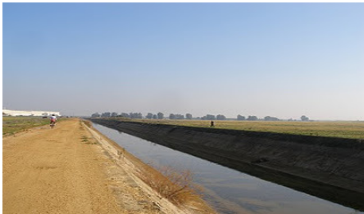
El Canal del Bajo Guadalquivir en la actualidad

Al terminar la guerra civil en 1939 todo el país se vio afectado por las nuevas condiciones políticas y económicas: controles de residencia y desplazamiento, cartillas de racionamiento y el exilio o la prisión de los derrotados. Estos presos acababan en los campos de trabajo cuya finalidad era conseguir mano de obra barata y disciplinada.