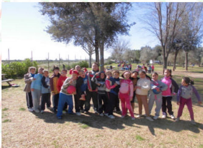
Llegamos y tomamos de posesión del parque.