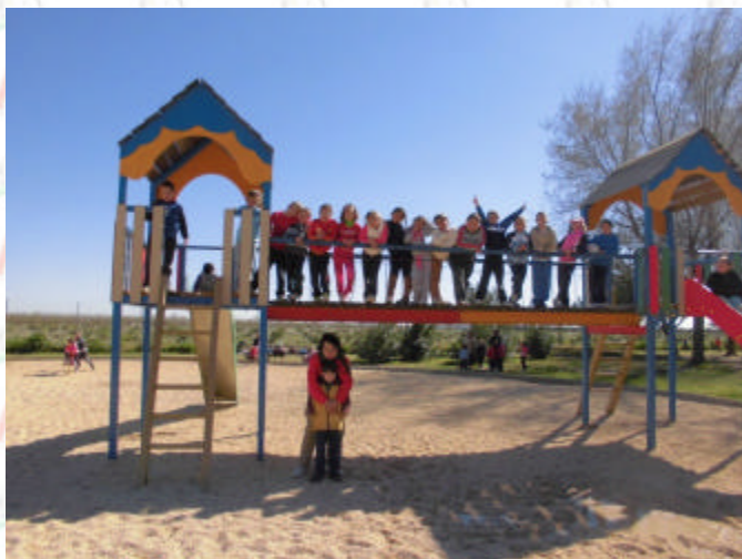
Hay que probar todos y cada uno de los columpios.