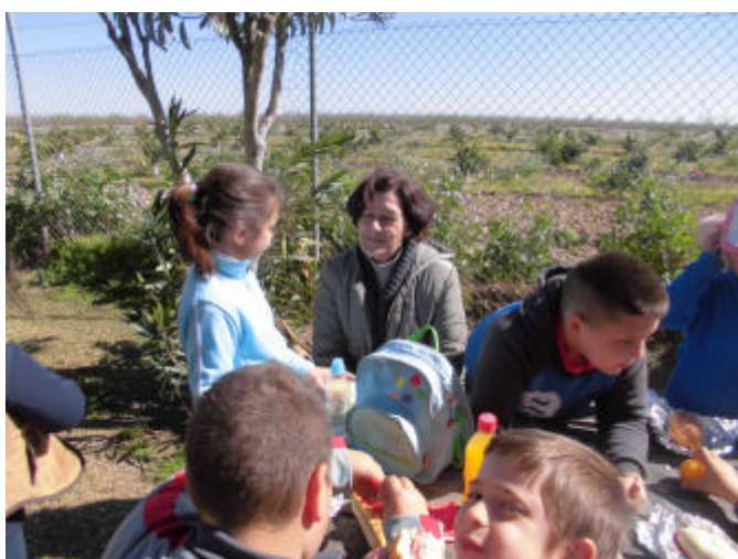
Es la hora de vaciar la mochila y llenar la barriga.