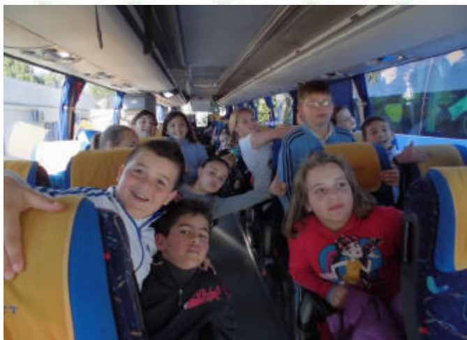
Aquí estamos , dispuestos a dar la lata a chófer y profesores con nuestras canciones de ruta.