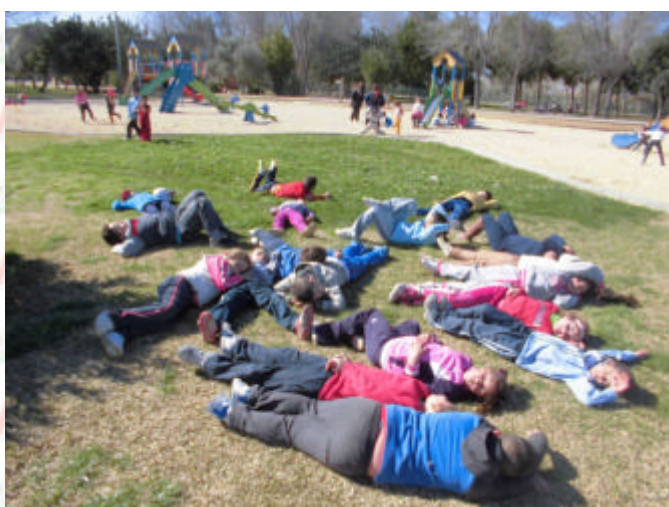
Y después de comer.. Una buena siesta.