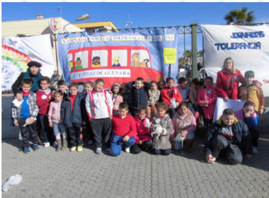
Tutoría de 2ºB, trabajo conjunto