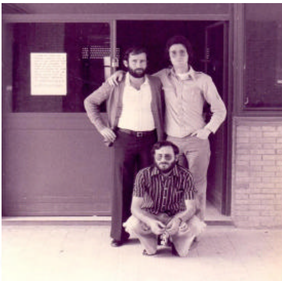
Profesores del primer claustro

En el curso 1973/74 empieza la andadura nuestro centro, pero este comienzo no está exento de problemas. El colegio no puede comenzar las clases porque, aunque tiene alumnos y profesores, no tiene dotación material, ni personal de limpieza ni administrativo. Las madres y los padres del barrio lucharon y se manifestaron por la apertura del centro, la cual se consiguió en condiciones normales en Enero del 1974.