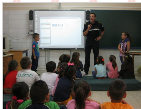
En la foto alumnado de 3º en el aula de informática