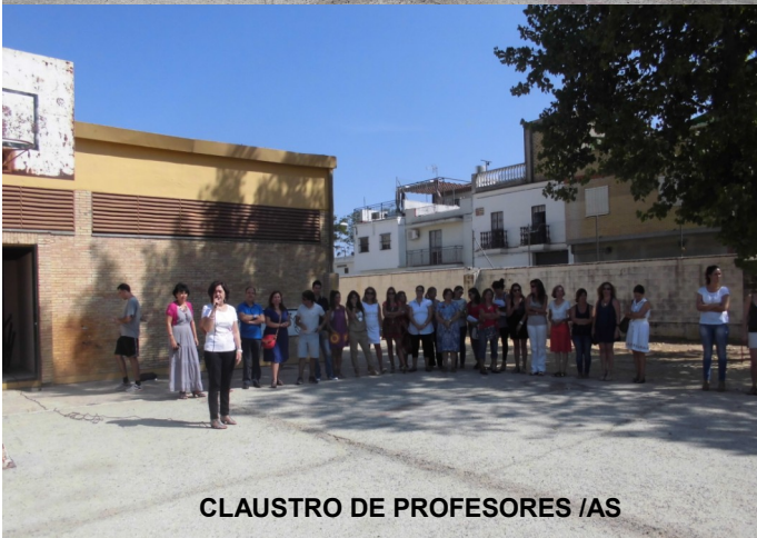
CLAUSTRO DE PROFESORES /AS