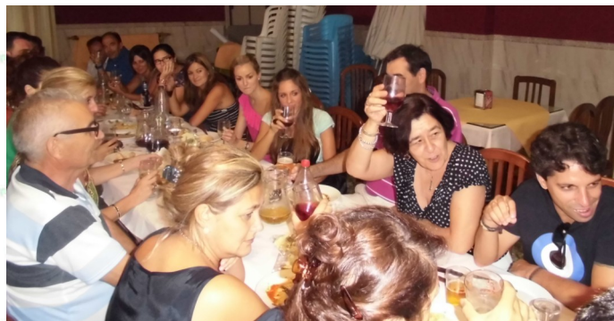
La Directora haciendo un brindis por el nuevo curso

Como cada principio de curso los maestros y maestras del curso actual y los del curso anterior que han cambiado de destino celebramos el principio de curso de una de las mejores maneras que se puede hacer, es decir, pasando un buen rato juntos y tomando unas copitas y tapitas en un bar del barrio