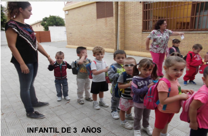
INFANTIL DE 3 AÑOS

No sabemos si esta expresión de alegría ha salido de la boca de nuestro alumnado o quizás de las de sus familias, pero sea como sea estamos de nuevo aquí y seguros de que será un magnífico curso con poco que todos nos lo propongamos..