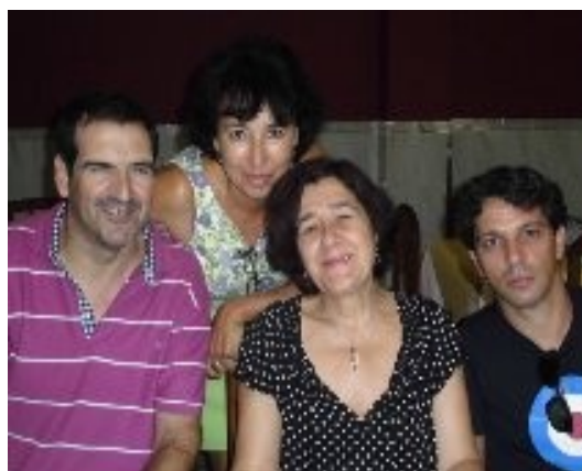
EL EQUIPO DIRECTIVO ACTUAL

Mi deseo para toda la Comunidad educativa es que tengamos un buen curso y que como yo siempre digo cualquier problema que se nos presente lograremos solucionarlo si remamos todos y todas en la misma dirección.