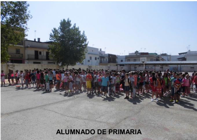
ALUMNADO DE PRIMARIA